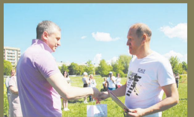
ФК «Парус» отметил 28-ой День рождения стр. 4