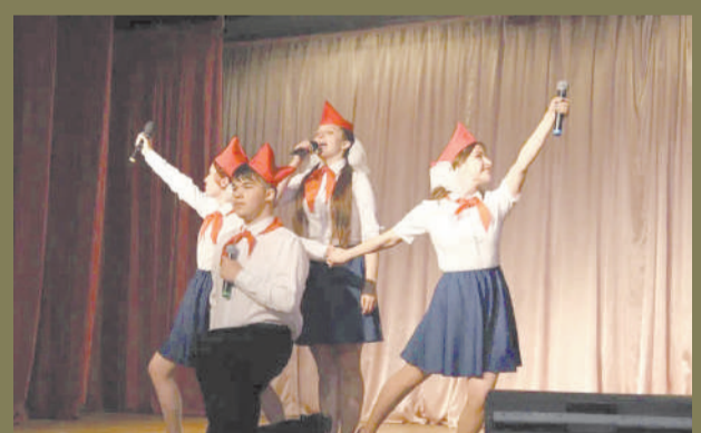
Ивангородцы отметили День России стр. 4