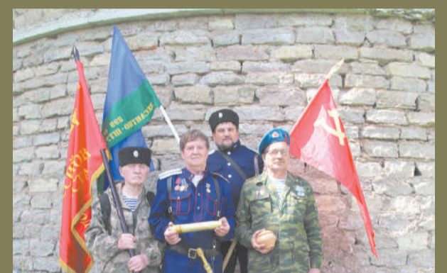
В Ивангороде проходит акция «Земля доблести» стр. 3