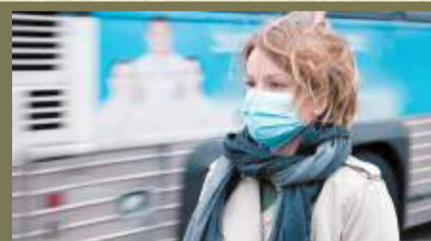
Где теперь можно стричься и покупать одежду в Ленобласти с 12 мая