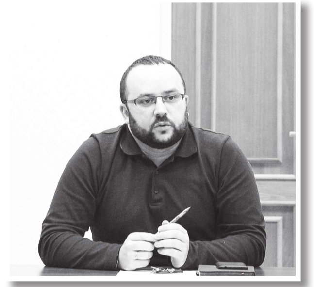
нескольких взаимосвязанных территорий общего пользования – площадей, набережных, улиц, пешеходных зон, скверов, парков и иных территорий.

За два года было отобрано 160 проектов-победителей, которые реализуются на территории 63 субъектов Российской Федерации, в том числе четыре – в Ленинградской области. Чтобы принять участие в конкурсе, муниципальному образованию необходимо подать заявку, включающую комплекс мероприятий по благоустройству одной или