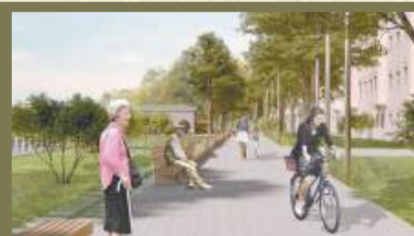
Ивангородский микрорайон Парусинка получит новый наряд