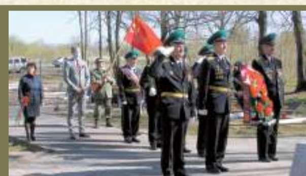
Ивангород принял участие в акции «Эстафета Победы»