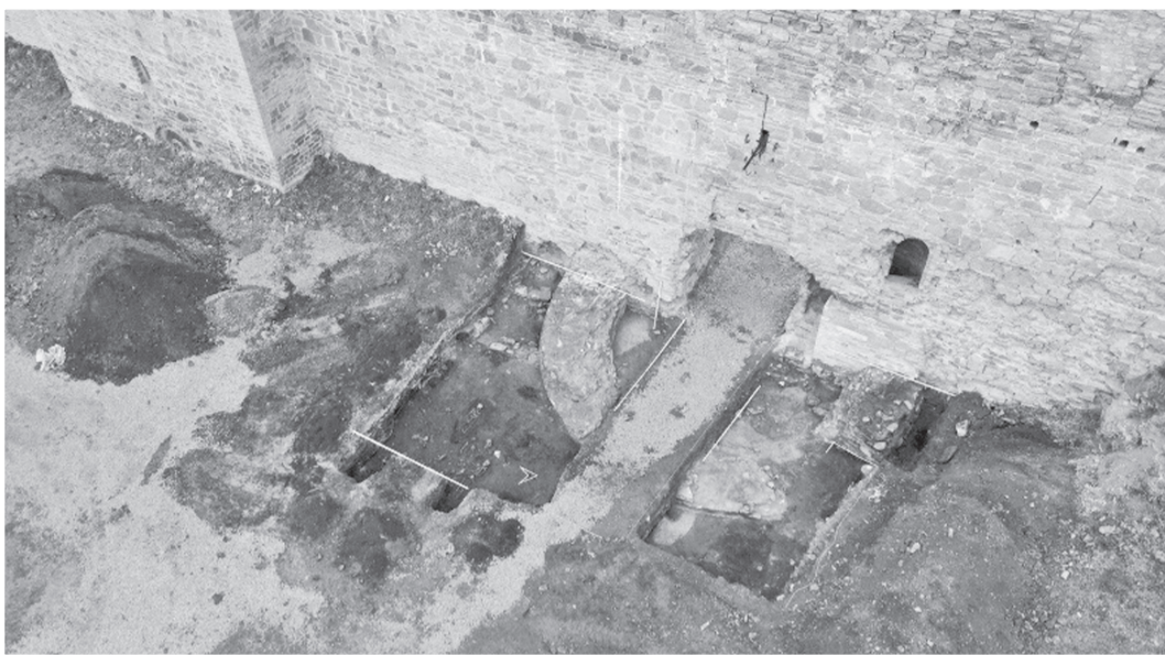
Археологические раскопки и наблюдения будут осуществлены в три этапа и продлятся до 2023 года

Исследования являются одним из этапов реставрации Большого амбара, расположенного на территории Ивангородской крепости. Восстановление исторического здания – российская составляющая международного проекта «Развитие уникального приграничного ансамбля крепостей Нарвы и Ивангорода как единого культурного и туристического объекта», 2-й этап. В 2023 году в Большом амбаре разместится музейная экспозиция, посвящённая истории Ивангорода.