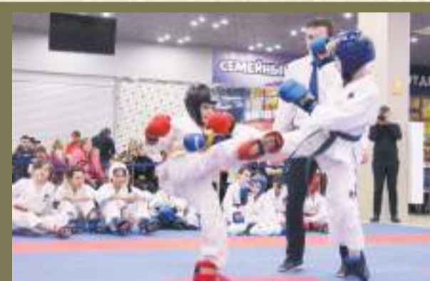
Юные тхэквондисты состязались в Кингисеппе стр. 5