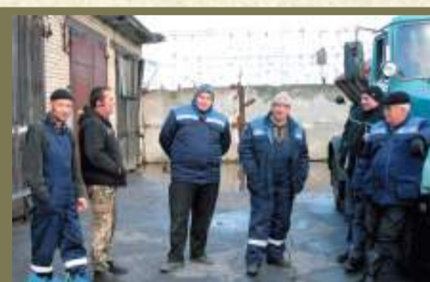
Службе заказчика МО «Город Ивангород» 10 лет стр. 4