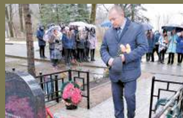
«Ждите меня, я скоро вернусь героем!» стр. 15